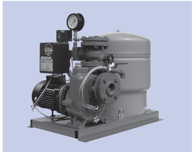
※写真と実際のユニットは塗装色等一部異なる場合がありますのでご了承ください。